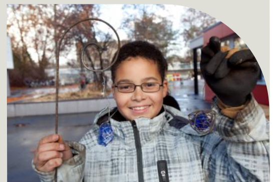
Schmieden macht Spass